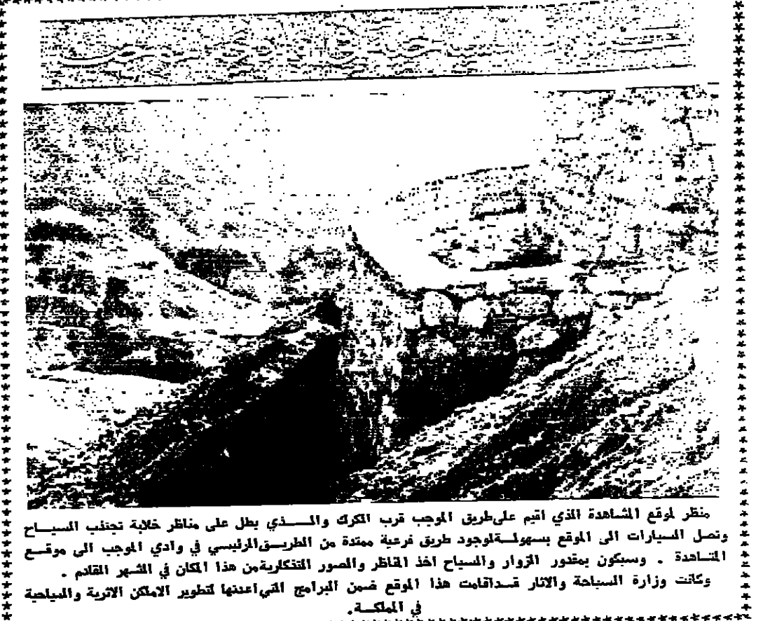
منظر لوقت المشاهدة الذي اقيم على طريق الربيع قرب الكرك والسذي يطل على مناظر خلابة تجذب السياح وتصل السيارات الى الموقع بسهولة لوجود طريق فرعية ممتدة من الطريق الرئيسي في وادي الموجب الى موقع المشاهدة. ويسكن بخور الزوار والسياح اهل القنطرة والمور والتفكير من هذا المكان في الشهر القلم. وكانت وزارة السياحة والاتر قد اعدت هذا الموقع ضمن البرامج التي اعدتها لتطوير الامكان السياحية والمليحة في المملكة.

الامم المتحدة - رويتر - تبدأ لجنة جديدة لدراسة الامم المتحدة... (Text continues with news about an international commission to study the impact of international trade on the environment)